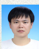
金城工程师 新誉集团有限公司