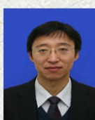
马东阁教授 华南理工大学